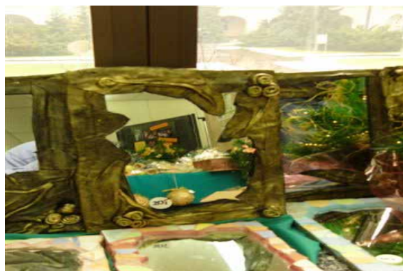
Prace ręczne uczestników terapii zajęciowej