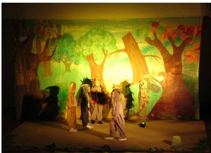
„Kruszynki” z Lublina