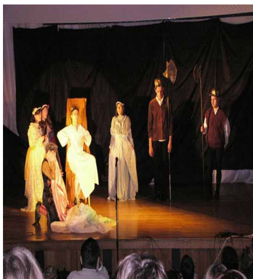
Teatr - tworzenie piękna