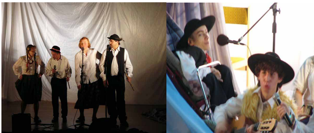
Prezentowano spektakle teatrów

W ramach Konferencji odbył się VIII Międzynarodowy Konkurs Piosenki Nieprzetaretego Szlaku „Góry”.