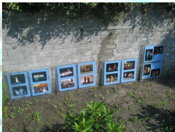
Aranżacja wystawy: B.S.

Z ewaluacji wynika, że uczestnicy seminarium chcieliby kontynuacji. Tekst oraz opracowanie komputerowe: B.S.